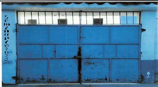
Foto 3: Reparacion de porton y modificacion, se le colocara puerta para ingreso controlado