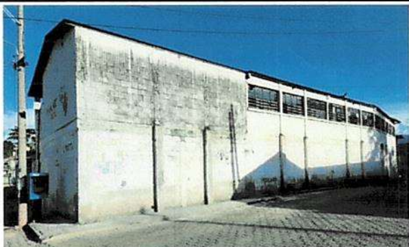
Foto 2: PAREDES CON MOHO, A COLOCAR CANAL, REPELLO Y PINTAR, LA HUMEDAD PASA ADENTRO DE LOS SALONES Y HACE MOHO