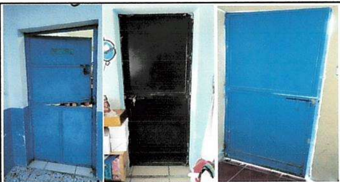
Foto 5: REPARACION DE PUERTA 1 SE NECESITA CAMBIO DE VISAGRAS PINTURA Y AJUSTE PORQUE CUESTA QUE CIERRE